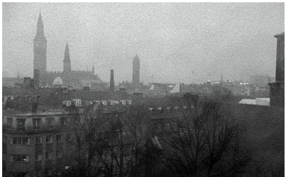
Still fra Jørgen Leths portrætfilm om Thomsen, Jeg er levende , fra 1999