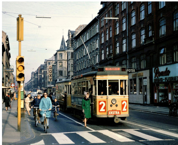
Godthåbsvej i 1967