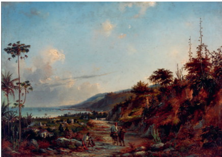
Fritz Melbye, Den nye vej til La Guaira , u.å.