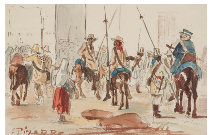
Camille Pissarro, Gadescene, menneskemængde , u.å.