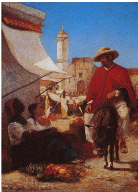
Camille Pissarro, Markedsscene på Plaza Mayor, Caracas , 1852-1854