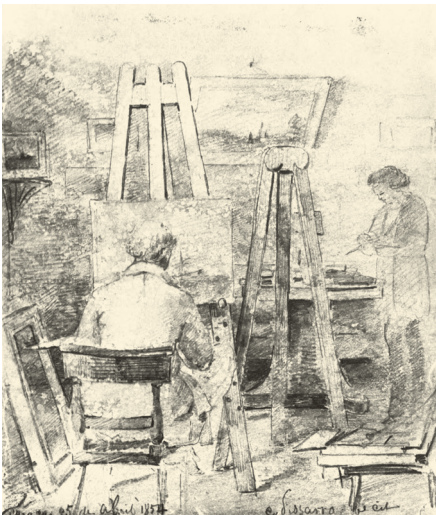
Camille Pissarro, Pissarro og Melbyes atelier i Caracas , 1854