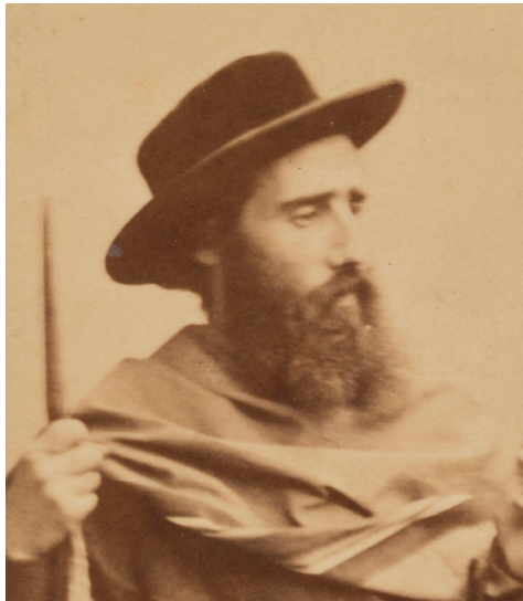
Camille Pissarro (1830-1903)