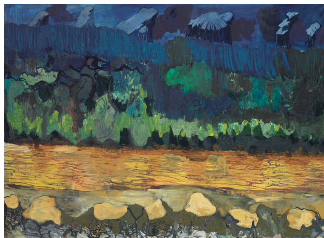
Per Kirkeby, Weltundergang , 2001-2002