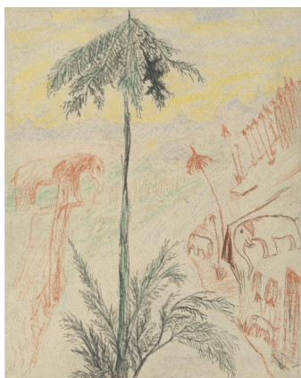
Carl Fredrik Hill, Landskab med elefanter , u.å.

”Min tanke er at tilfredsstille mig selv med en kollage af billeder, der tilsammen udgør min ungdoms, naive om man vil, kærlighed til de primært nordiske kunstnere og deres følge, som en slags flettet billedtæppe, der både kan ses som en helhed, eller i detaljen.”