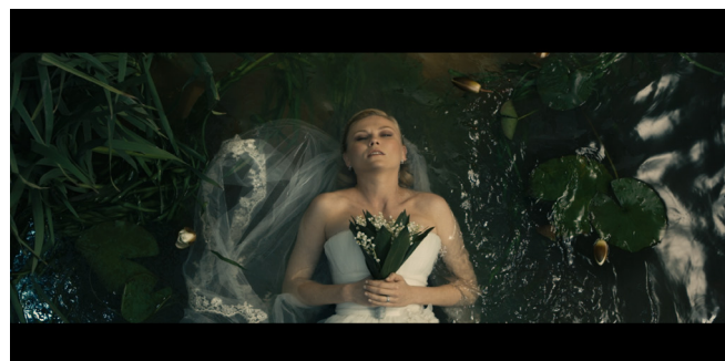
Lars von Trier, Melancholia , 2011