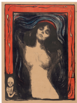
Edvard Munch, Madonna , 1895/1902