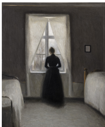
Vilhelm Hammershøi, Sovekammer , 1890