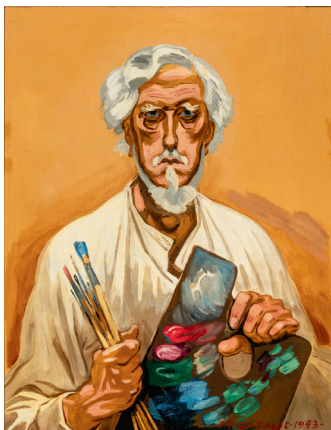
Selvportræt på 80-årsdagen, 1943