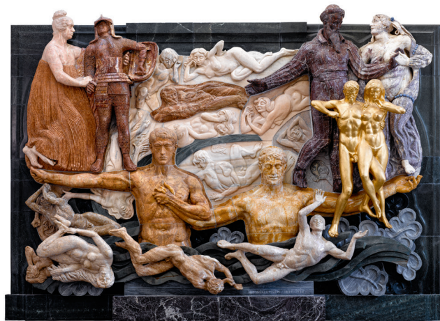
Det store relief, 1893-1928