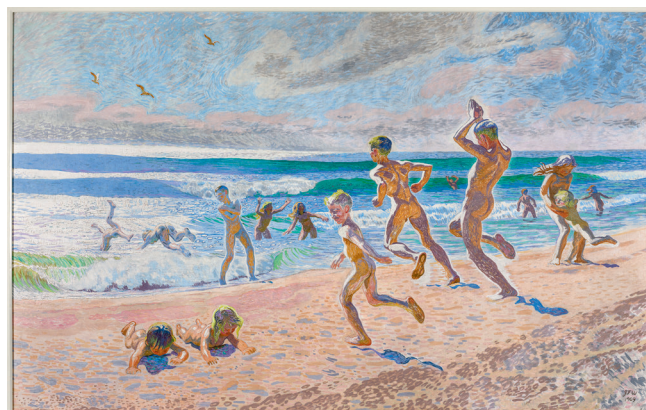
Badende børn, 1909