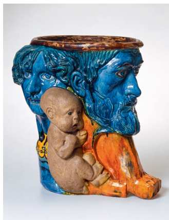
Faderen, moderen og deres nyfødte barn, kaldet Familievasen, 1891