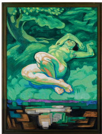
Den grønne pige. Nogen kvinde liggende i skoven, 1920-22