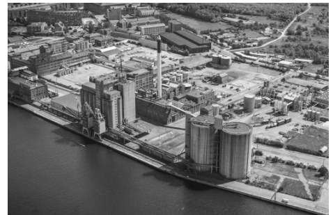
Islands Brygge, 1989