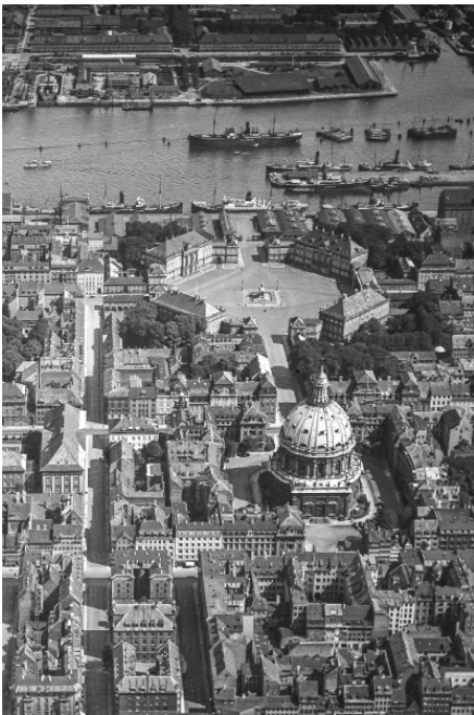
Frederiksstaden, 1932-37

For bestilling af presseeksemplarer, pressefotos og kontakt til forfatter og fotograf, kontakt presseansvarlig Mette Wibeck på +45 4075 3476 eller mette@strandbergpublishing.dk . Pressekit med fotos på www.strandbergpublishing.dk/presse