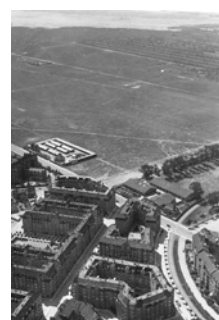
Ørestad, 1924 (Ubekendt)