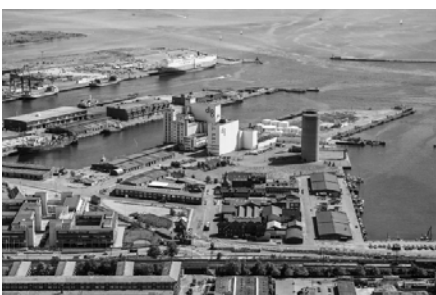
Nordhavn, 1989