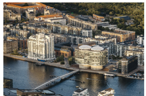
Nicolas Cosedis, Islands Brygge