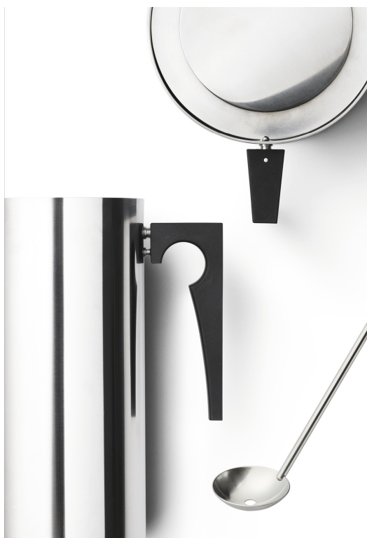
Arne Jacobsen, Cylinda-line, 1964-67