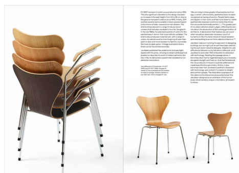
Vilhelm Wohlert, Louisiana Stol, 1957-58