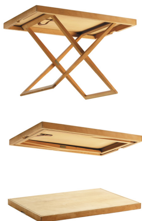
Mogens Koch, MK-49, 1938/1960