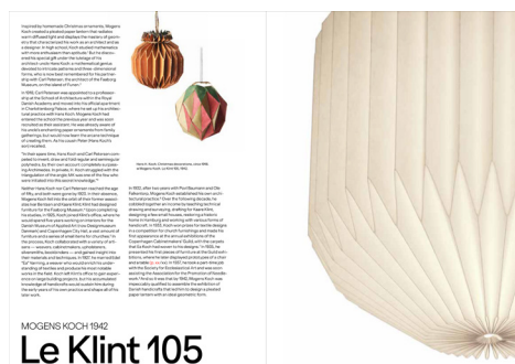
Mogens Koch, Le Klint 105, 1942