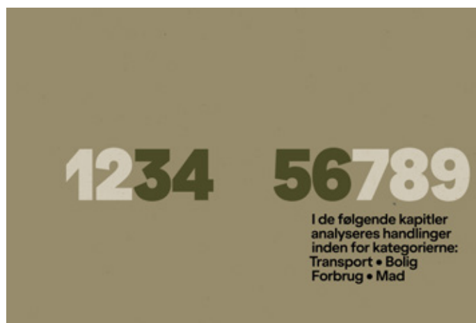
Eksempler i kategorierne transport, bolig, forbrug og mad