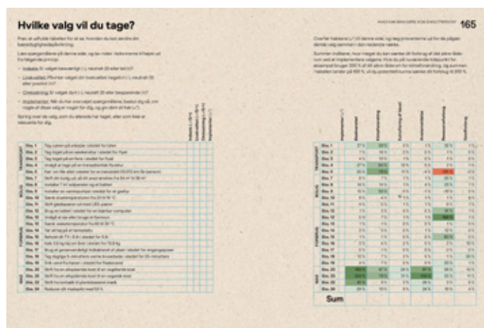
Se, hvordan du kan ændre din miljøpåvirkning