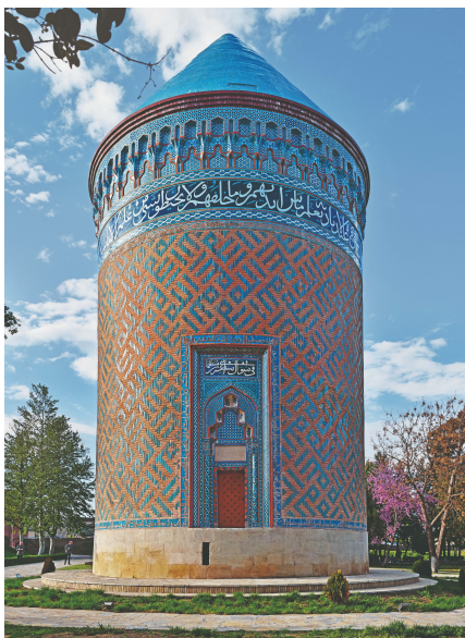
Barda-mausoleet i Azerbaijan