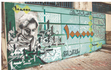
Graffiti i Beirut, Libanon