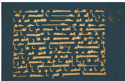
Koranside fra Nordafrika