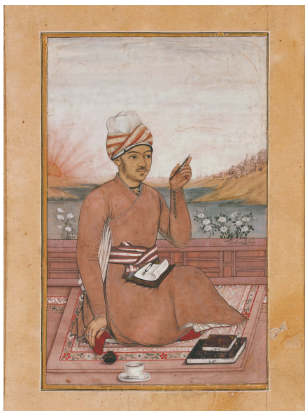
Portræt af en ukendt, ung kalligraf