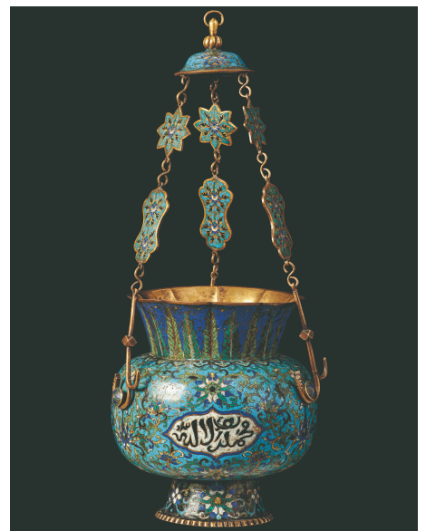
Lampe af cloisonnéemaljeret bronze