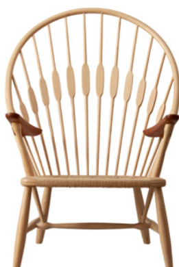
Påfuglestolen af Hans J. Wegner