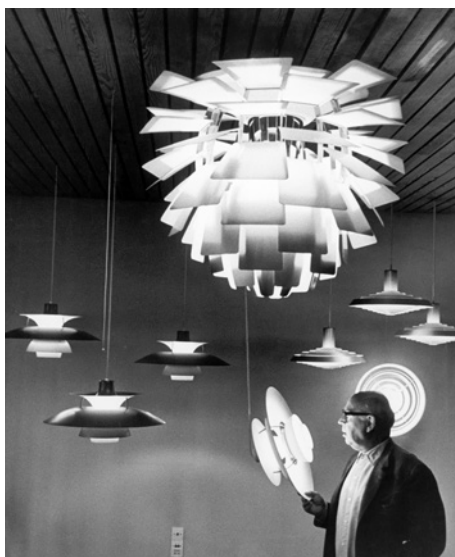
Koglekrone og PH 5 af Poul Henningsen