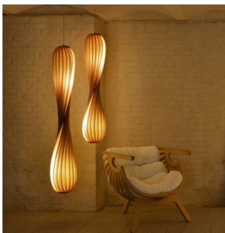
TR7 af Tom Rossau