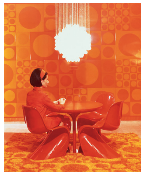
Fun-lampe og stol af Verner Panton