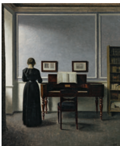
Vilhelm Hammershøi, Interiør , 1901