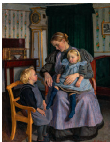
Fritz Syberg, En mor, der fortæller sine børn historier , 1898-1899