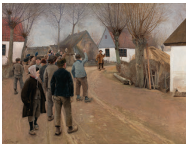
L.A. Ring, Den berusede mand , 1890