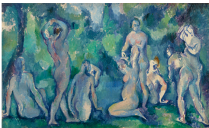
Paul Cézanne, Badende kvinder , ca. 1895