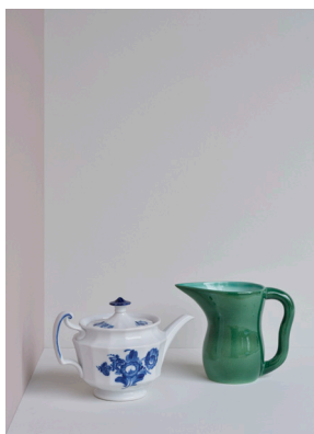
Blå blomst og Ursula

Forside og fotos fra bogen kan downloades på: strandbergpublishing.dk/presse