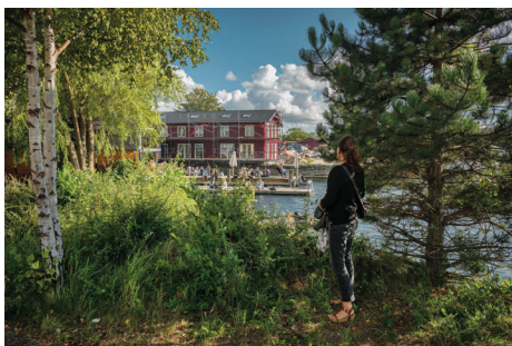
La Banchina, Refshaleøen