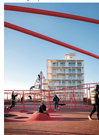
P-hus og konditaget Lüders