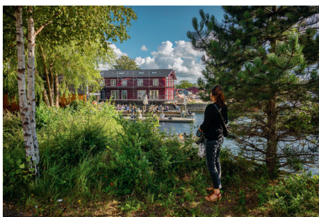
La Banchina, Refshaleøen