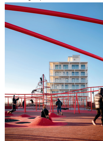
P-hus og konditaget Lüders