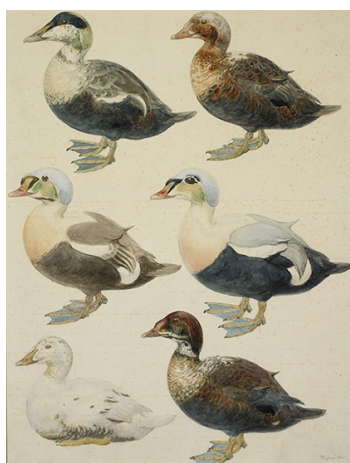
Edderfugl og Kongedderfugl (udat.) Planche til Danmarks Fugle