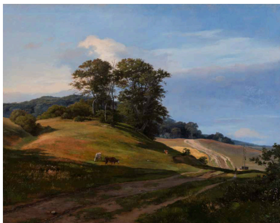
Johan Thomas Lundbye Landskab. Sørup Vang