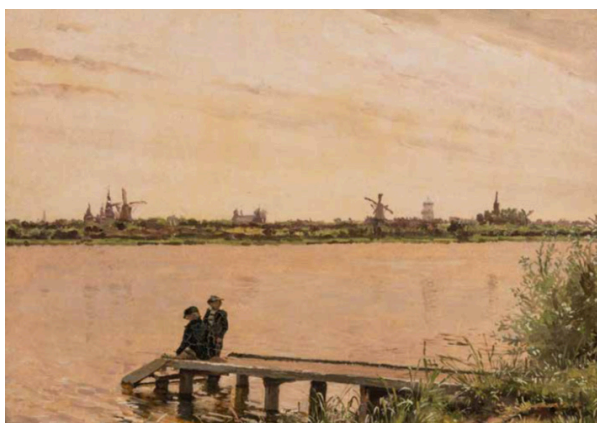
Christen Købke Parti af Dosseringen med to drenge på en bro