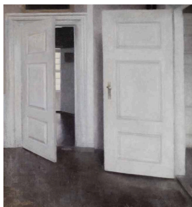
Vilhelm Hammershøi Hvide døre. Strandgade 30