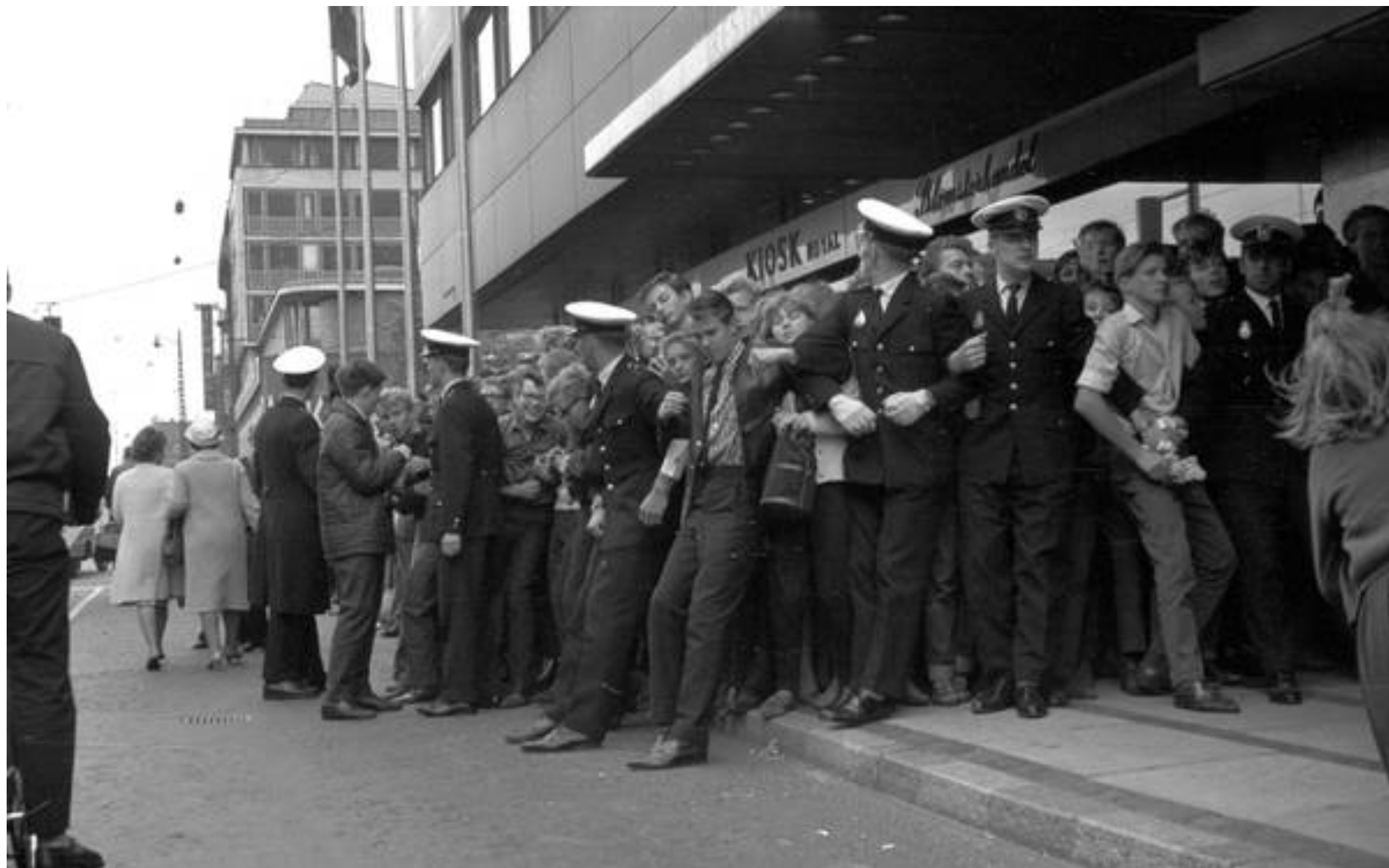
Kaos ved hotellet 1.