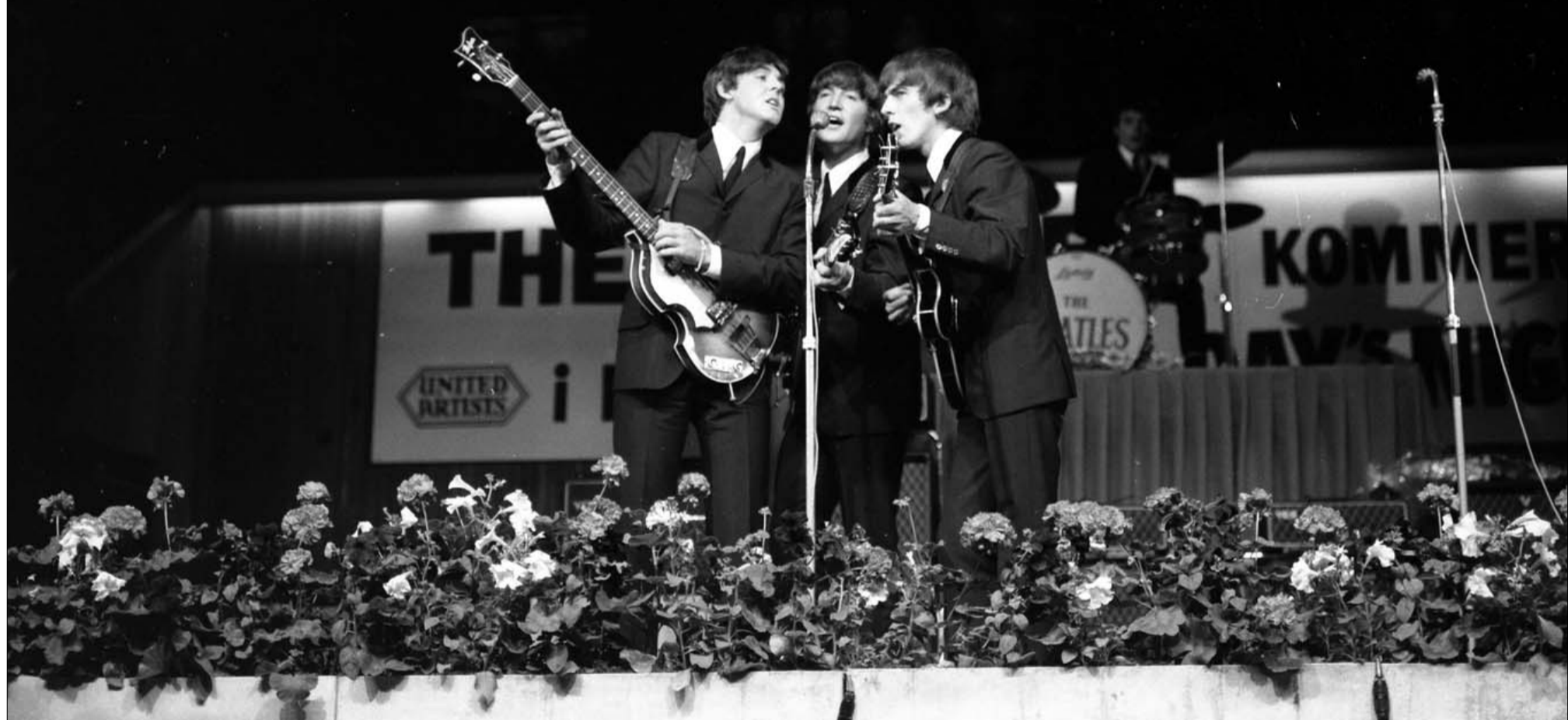
The Beatles optrådte to gange i KB-Hallen den 4. juni 1964. Jimmie Nicol i baggrunden var stand-in for en syg Ringo Starr. Forrest Paul McCartney, John Lennon og George Harrison.