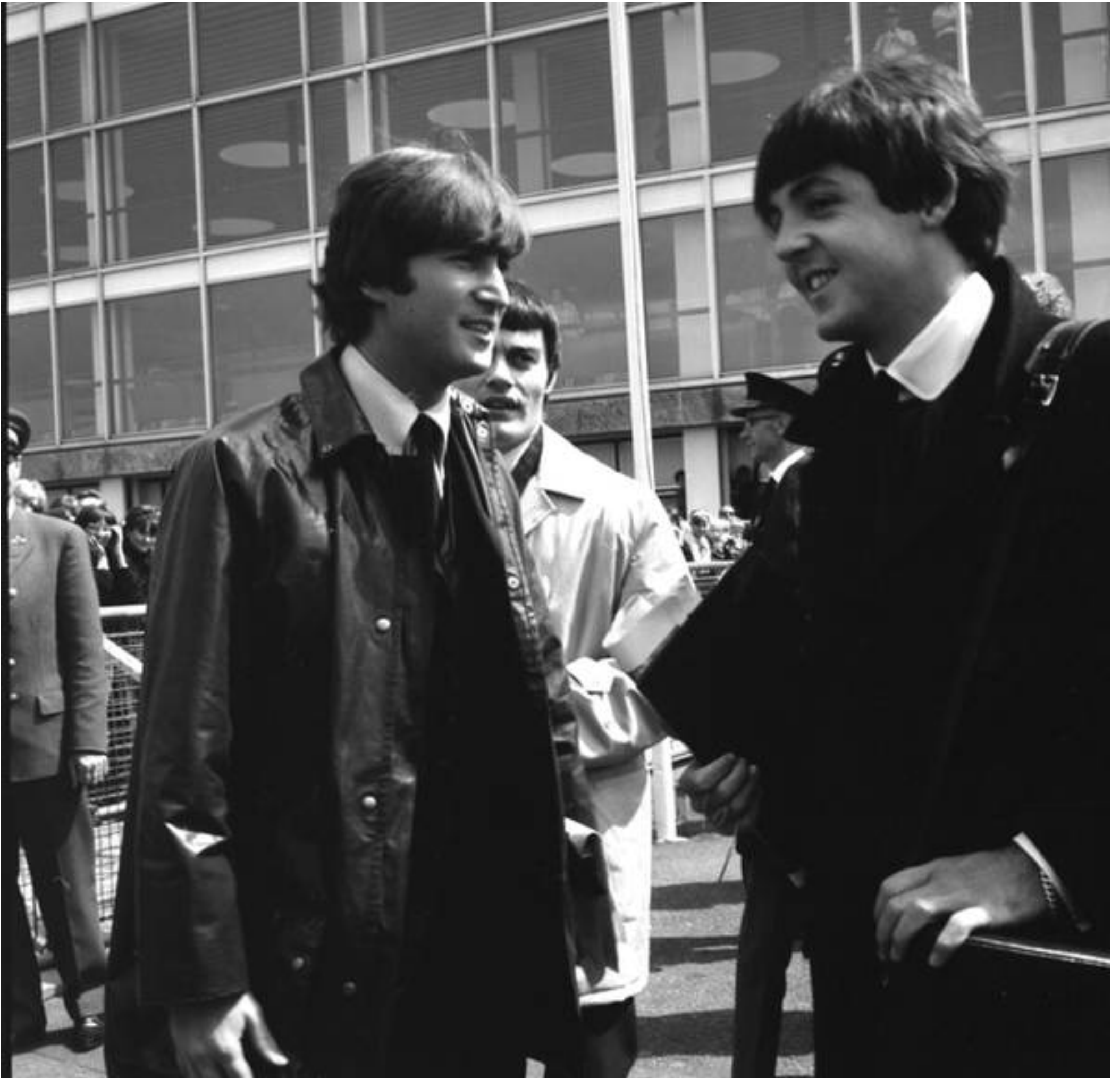
John, Paul og Jimmy Nicol i lufthavnen.