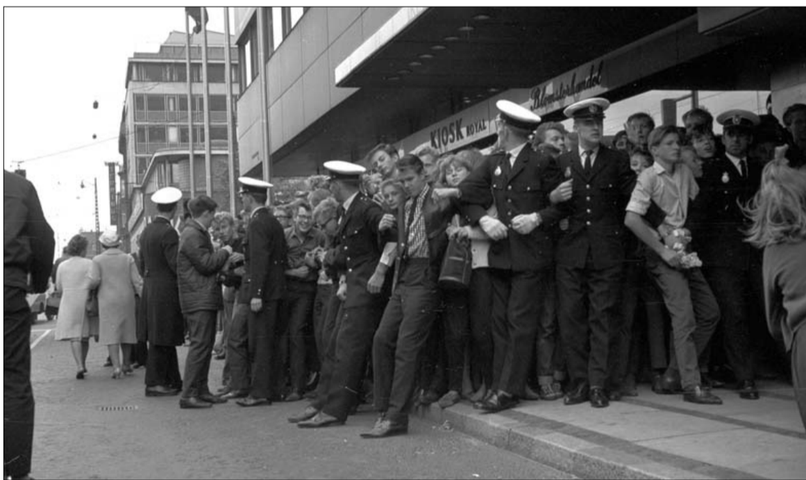
Billetterne til koncerterne med The Beatles blev sat til salg i maj 1964. De billigste billetter kostede 15 kr., de dyreste 50 kr. Her venter håbefulde billetkøbere i KB-Hallens foyer.

"Please Please Me" (1963), "With The Beatles" (1963), "A Hard Day's Night" (1964), "Beatles for Sale" (1964), "Help!" (1965), "Rubber Soul" (1965), "Revolver" (1966), "Sgt. Pepper's Lonely Hearts Club Band" (1967), "The Beatles" (1968), "Abbey Road" (1969), "Let It Be" (1970).