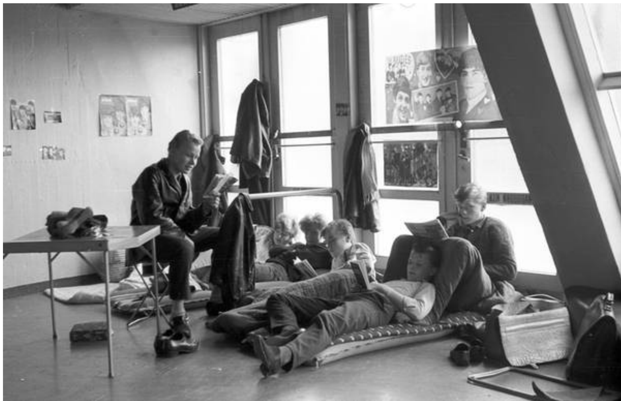
Allerede dagen før var der kø foran billetsalget.