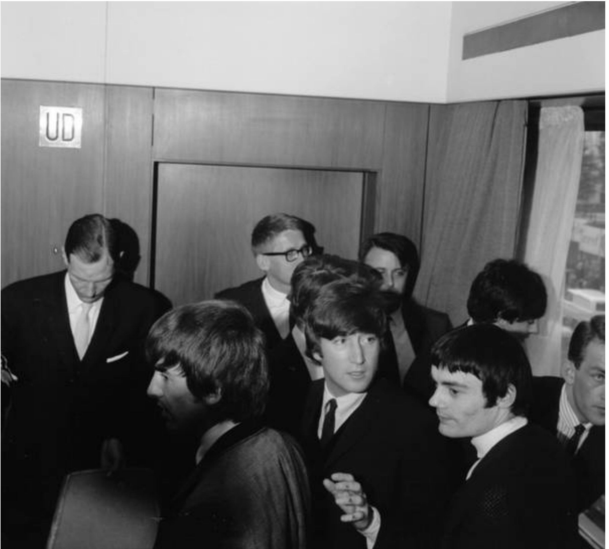
Ankomst til pressemødet.