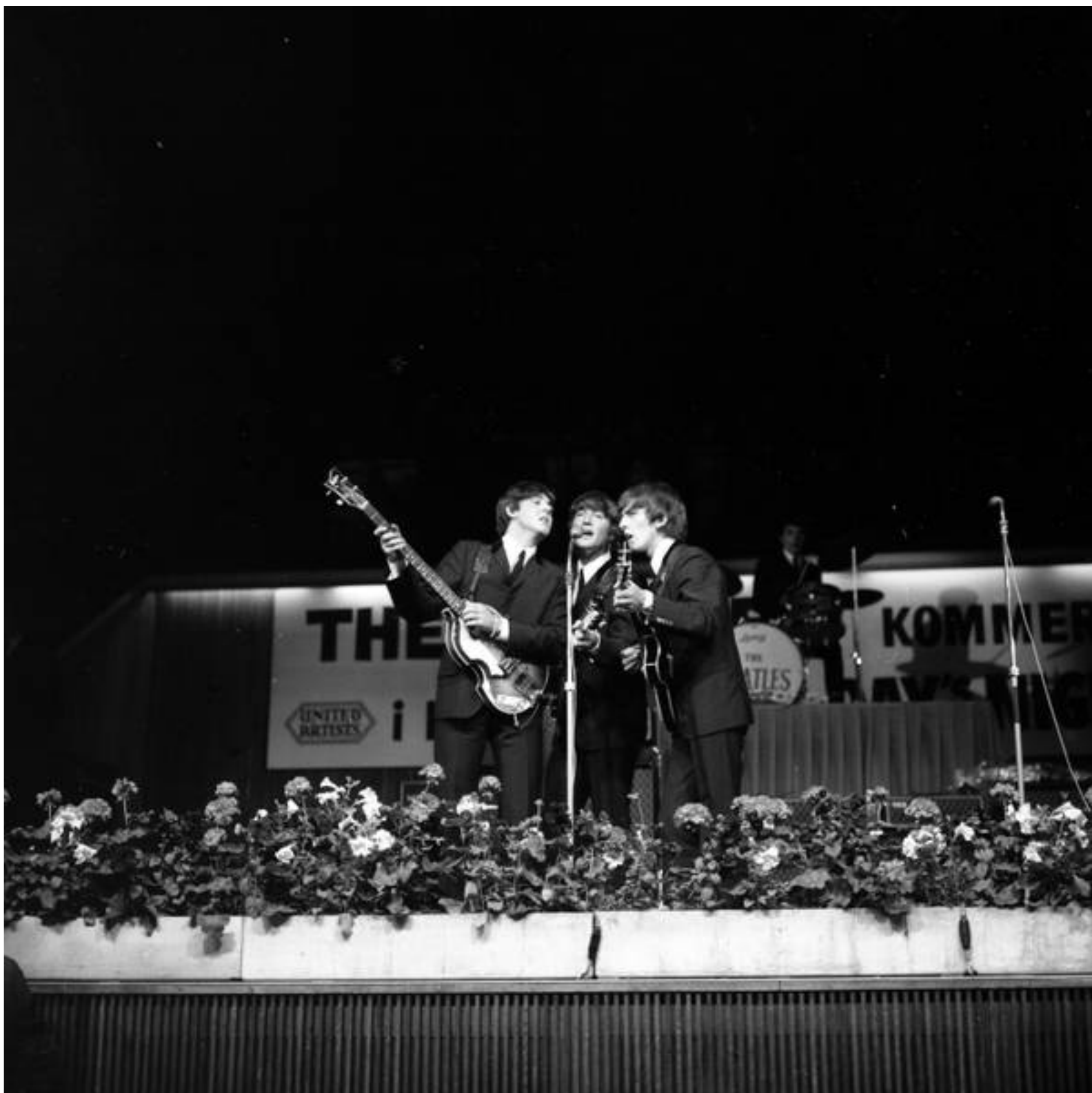
The Fabs i KB Hallen.