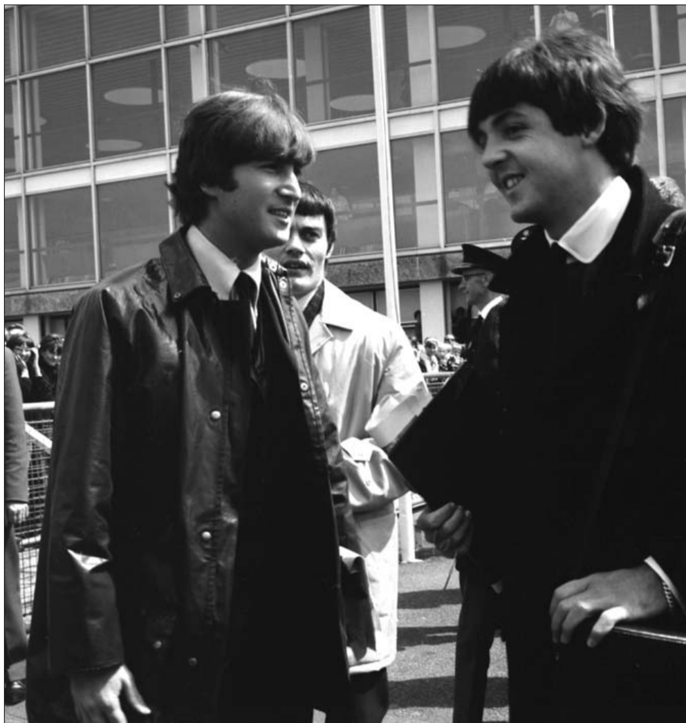
John Lennon og Paul McCartney i lufthavnen i Kastrup med klassisk Beatlehår og pænt klædt. I baggrunden Jimmie Nicol.