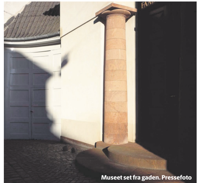
Museet set fra gaden. Pressefoto