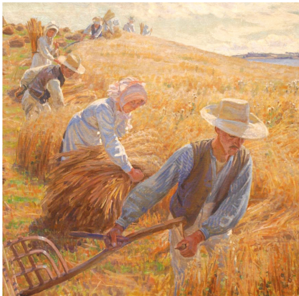
Peter Hansen, Høstbillede, 1910, Faaborg Museum.

Hvornår: Åbent juli og august dagligt 10-16, onsdage tillige til 18. Herefter: Tirsdage-søndage 10-16. Til 2. januar.