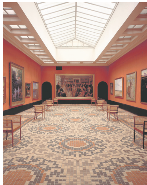
Hovedsalen i Faaborg Museum.