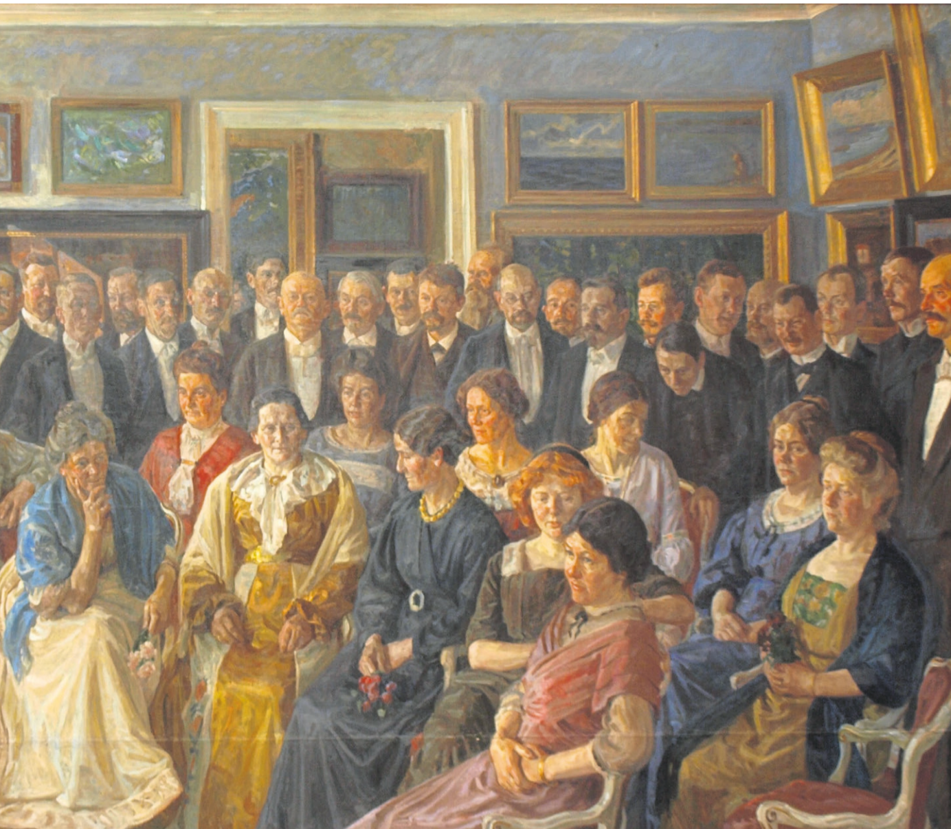
Peter Hansens maleri til minde om åbningen af Faaborg Museum. Pressefoto