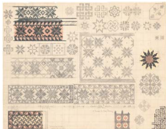
Skitsen over gulvet.