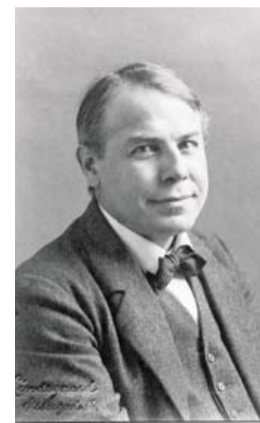
Arkitekt Carl Petersen tegnede Faaborg-museet.